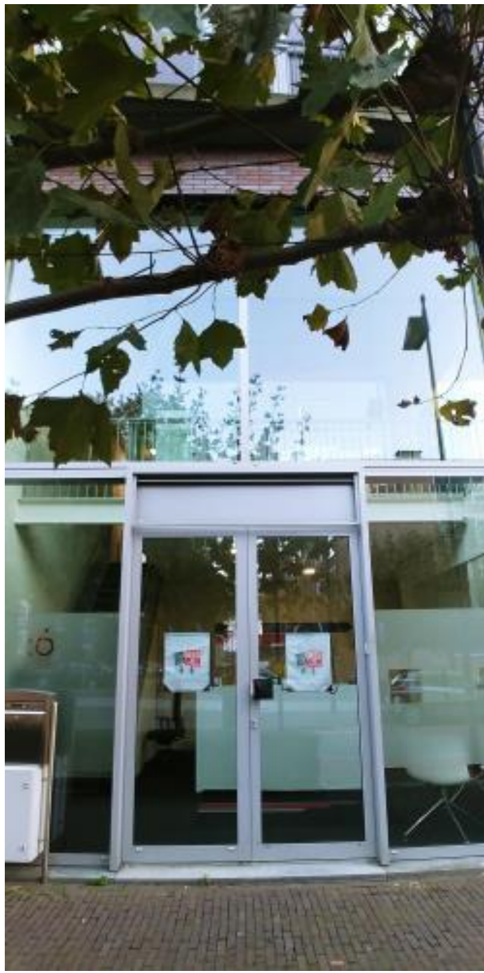
TABLEAU- EN STAGE-AANGELEGENHEDEN

Een deel van de bevoegdheden van de raad van de orde is gemandateerd aan de directeur van het bureau. Het bureau beoordeelt zelfstandig beëdigingsverzoeken en verzoeken tot goedkeuring patronaat. Waar nodig wordt overleg gevoerd met de portefeuillehouder opleidingen en de portefeuillehouder stagiaires van de raad van de orde. Ook verzoeken tot afgifte stageverklaring worden door het bureau beoordeeld ter voorbereiding van een besluit van de raad. In andere stage-aangelegenheden voert het bureau overleg met de portefeuillehouders / de Kleine Commissie van de raad van de orde.